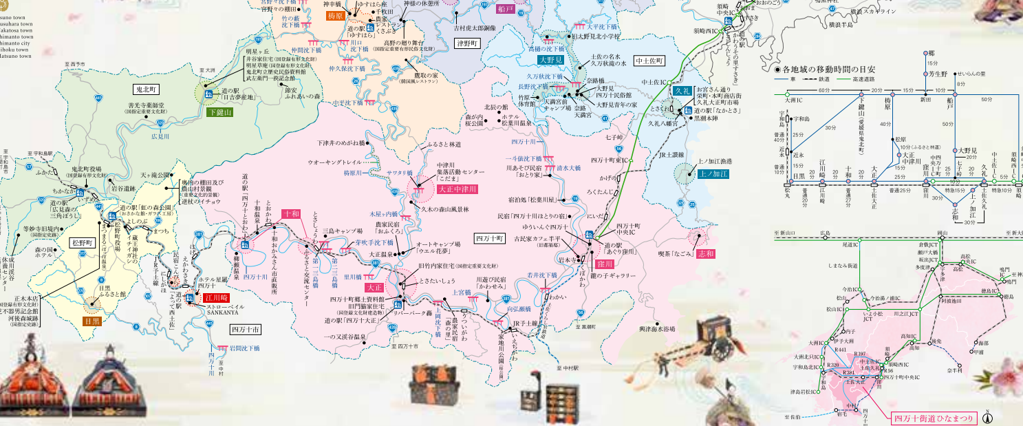
◎地域別開催スケジュール

各地域の展示場所や時間はそれぞれ異なります。詳細は、それぞれの地域までお問合せください。