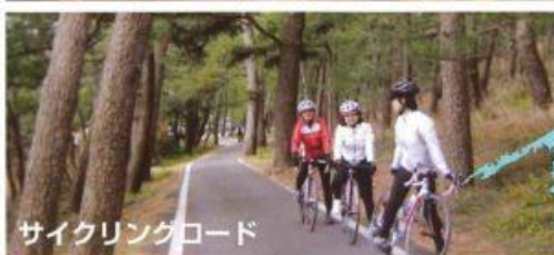
サイクリングロード